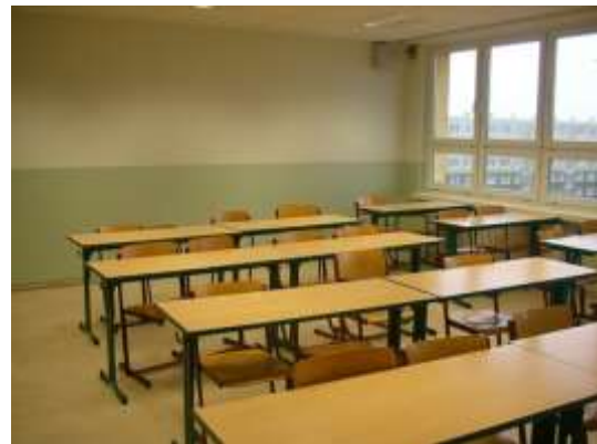
Unsere hellen und freundlich eingerichteten Klassenräume!