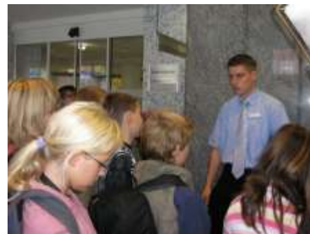
Die 5. Klasse bei der Raiffeisenbank.

Die 8. Klassen beim 14-tägigen Praktikum im Berufsbildungs- und Technologiezentrum der Handwerkskammer Schwerin